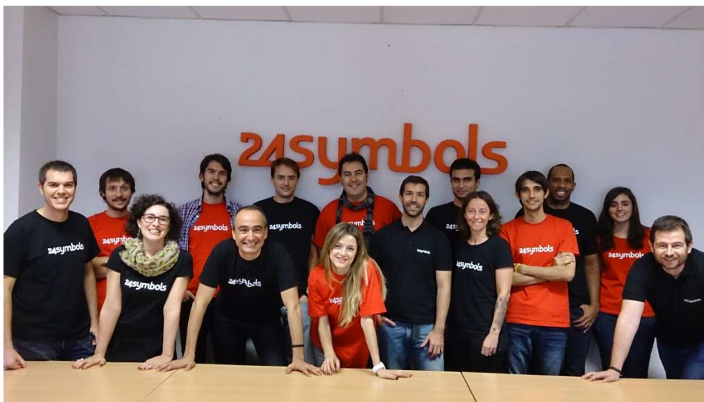
Equipo actual de 24symbols en su sede de Madrid.

24symbols es otro de los servicios que, desde 2010, permite leer de forma ilimitada con un pago mensual fijo y, en este caso, permiten además leer una serie de títulos de forma totalmente gratuita (financiado con publicidad) tanto en tablets y smartphones como en PC. La compañía española (que pertenece al mismo grupo que ZED o que el centro universitario U-Tad) cuenta con más de 200.000 eBooks en su catálogo y acaba de firmar recientemente un acuerdo con Internet.org , la iniciativa de Mark Zuckerberg para democratizar el acceso a Internet y los contenidos digitales en todo el mundo. Pasos que han permitido a 24symbols estar cerca de llegar al millón de usuarios registrados en todo el planeta , cifra que esperan alcanzar y superar durante 2015.