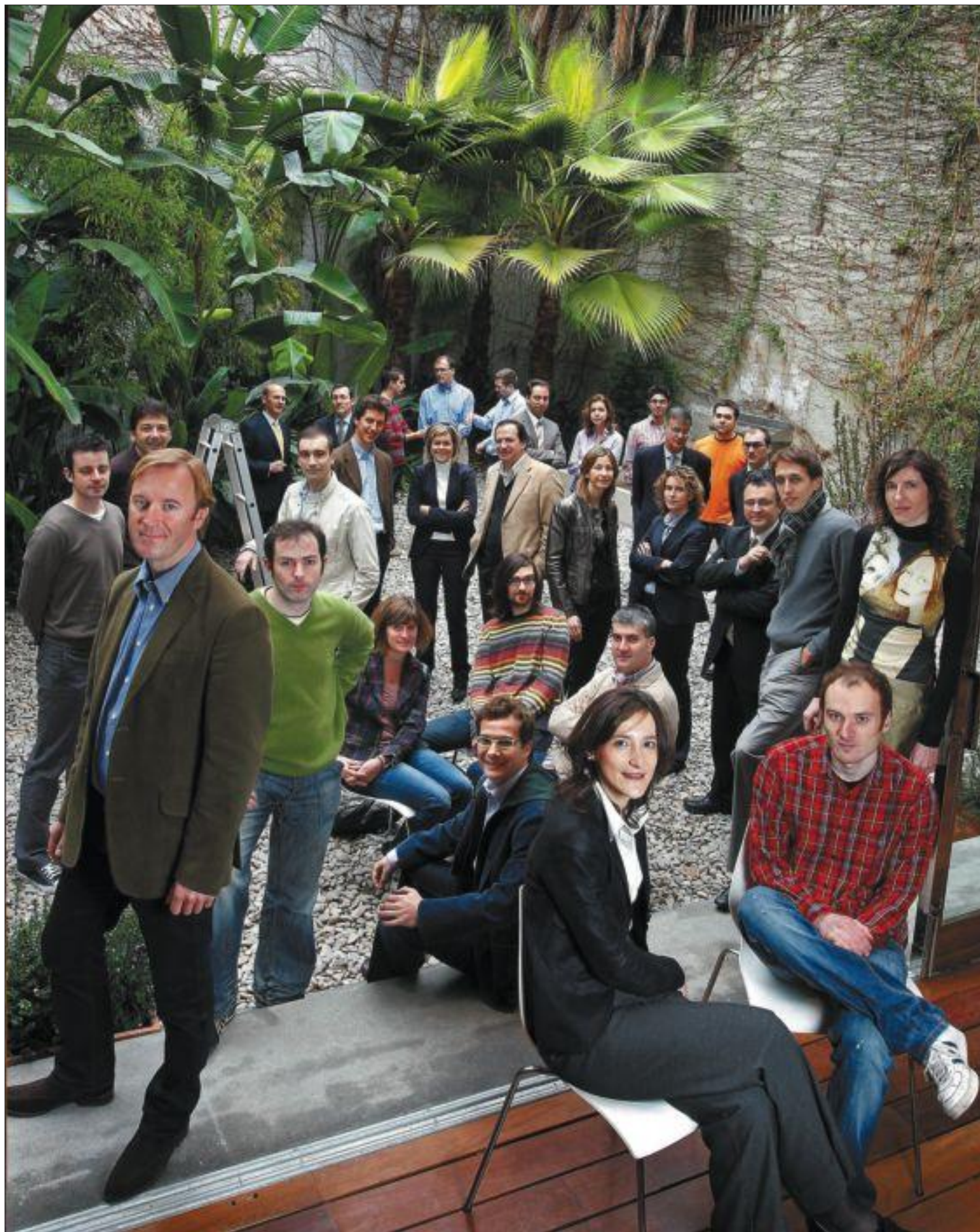
Concentración de inversores y emprendedores en la nueva librería Bertrand de Barcelona.