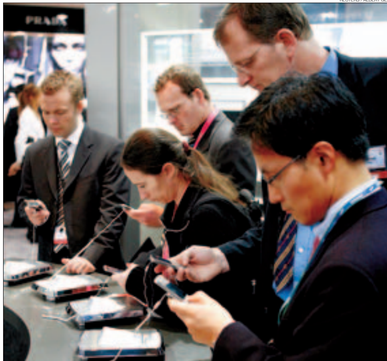
► Nuevos modelos ► Usuarios prueban terminales en un stand de la feria 3GSM.

► HALLAR UN RESTAURANTE Qdq permite enviar la dirección y el teléfono de un restaurante a los usuarios que se quiera. Páginas Amarillas localiza locales a partir de palabras clave.