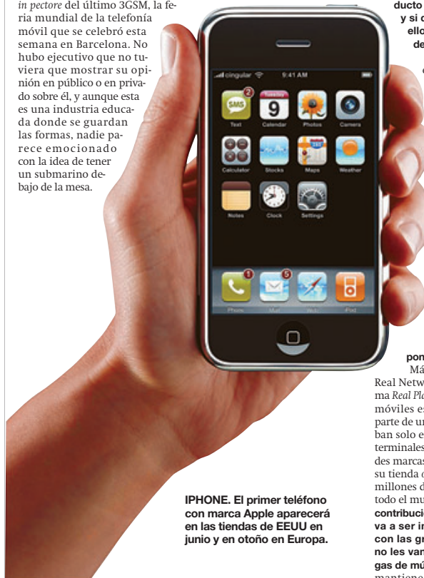
IPHONE. El primer teléfono con marca Apple aparecerá en las tiendas de EEUU en junio y en otoño en Europa.

Y como él, las operadoras también se preparan y recuerdan otras experiencias frustradas de añadir el lector MP3 al teléfono. En EEUU, iPhone saldrá con Cingular. En Europa, Vodafone le está enseñando la patita de operadora global para llevar el teléfono iPod a su catálogo. ¿Llévate Apple al próximo 3GSM? ≡