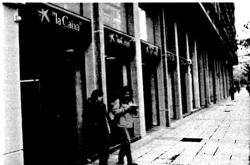
La Caixa lidera por tercer año consecutivo el Informe Merco Personas.

MICROSOFT, BBVA, CAJA MADRID Y TELEFÓNICA ENCABEZAN LA LISTA ELABORADA POR LA CONSULTORA VILLAFANE Y ASOCIADOS